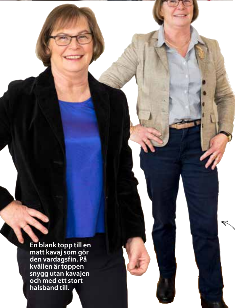
En blank topp till en matt kavaj som gör den vardagsfin. På kvällen är toppen snygg utan kavajen och med ett stort halsband till.