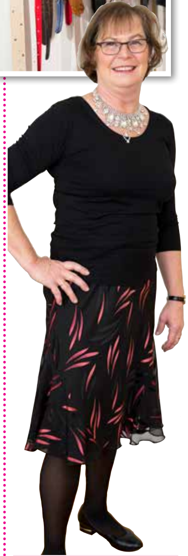
Kjolen, som var för lång, syddes upp och blev en riktigt fin festkjol tillsammans med en svart vardagstopp. Till det glittriga smycken och en liten metalldetalj på skorna.